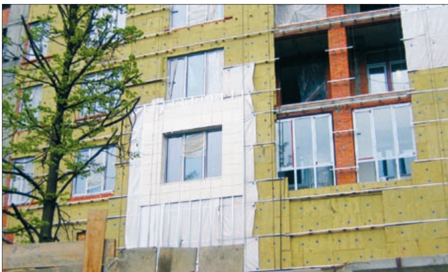
Фото 1. Установка ветрозащитной пленки между направляющими не позволяет получить толщину воздушной прослойки больше толщины вертикальной направляющей — 25 мм

Несущие функции в навесных вентилируемых фасадах выполняет металлический каркас (подконструкция), образованный горизонтальными и вертикальными направляющими. Очень часто в таких системах ветрозащитная пленка устанавливается не поверх утеплителя, что было бы логично, а между направляющими (фото 1). В результате толщина вентилируемой прослойки между пленкой и облицовкой становится равной толщине вертикальной на-