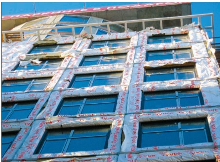
Фото 6. Повреждения ветрозащитной пленки при перерыве в монтаже фасада

Мы проводили работу, в процессе которой выполнялись расчеты увлажнения утеплителя вентилируемого фасада косым дождем с учетом аэродинамики здания. Результаты, полученные при анализе